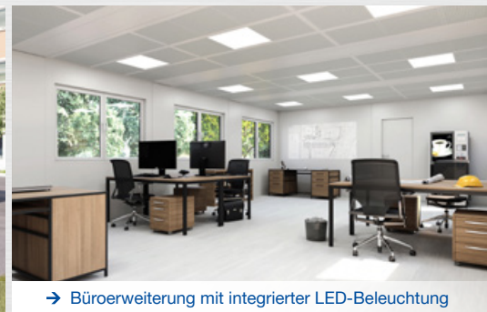
→ Büroerweiterung mit integrierter LED-Beleuchtung