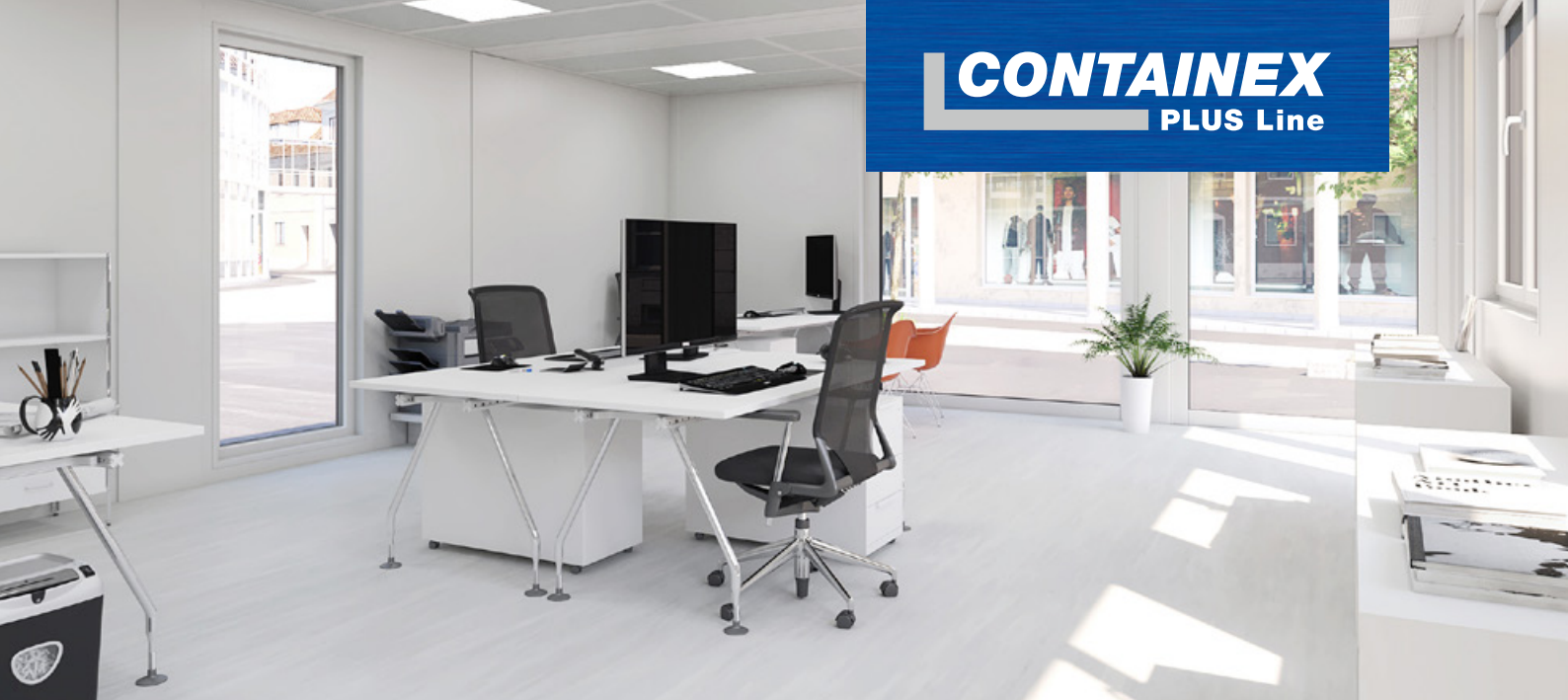
→ Attraktiver Büorinnenraum mit vielen Ausstattungsvarianten