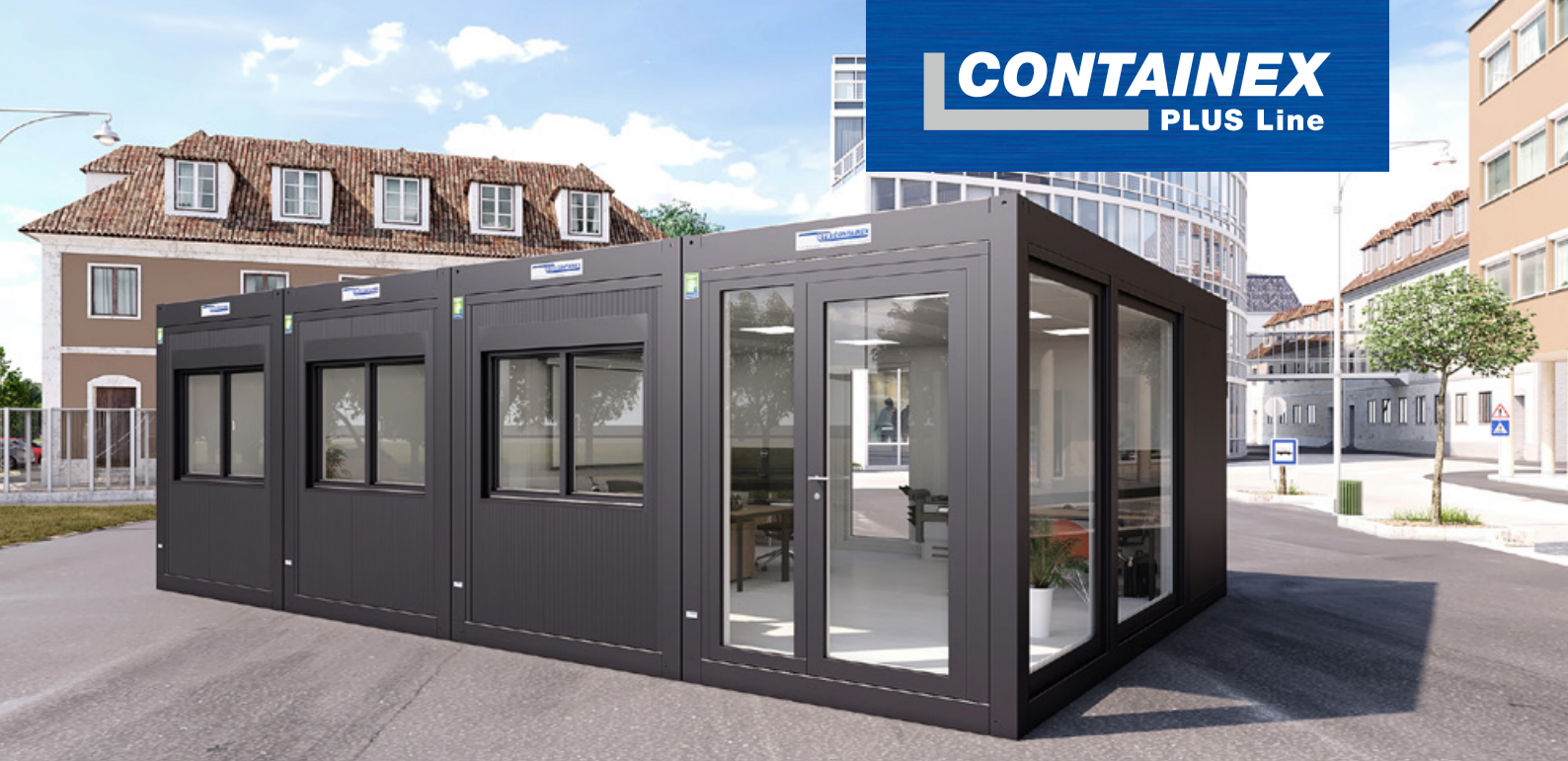
→ Büro in attraktivem Anthrazitgrau