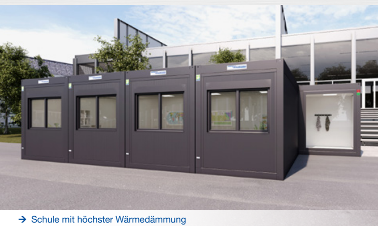
→ Schule mit höchster Wärmedämmung