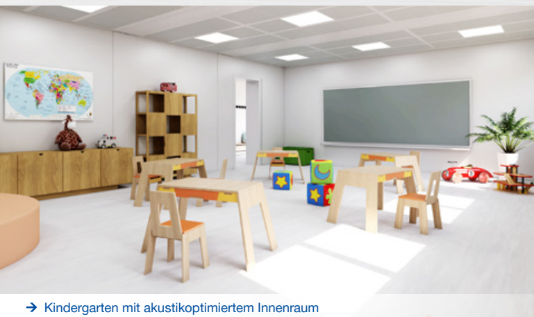
→ Kindergarten mit akustikoptimiertem Innenraum